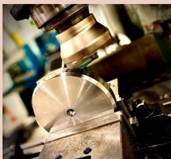
Skärande bearbetning fräs