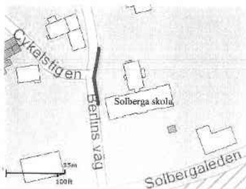
Figur 1, sträcka som avses i §1, enligt markering.